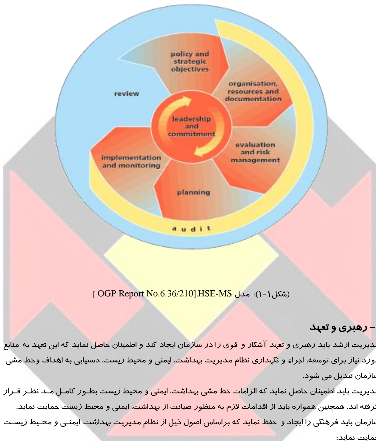
(شکل ۱-۱): مدل HSE-MS [ OGP Report No.6.36/210]